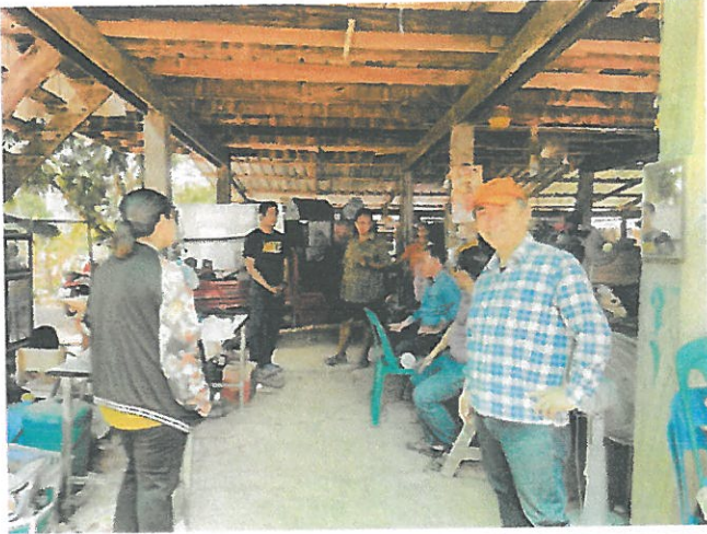
พื้นที่ ม.๕ ต.ไผ่ล้อม จำนวน ๑ คร้วเรือน