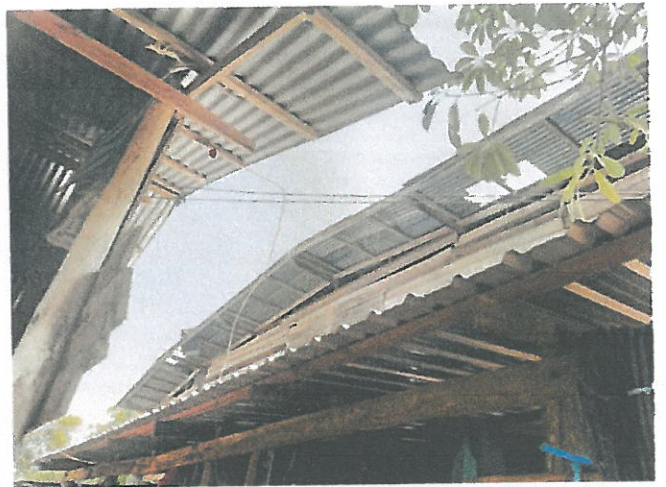
พื้นที่ ม.๗ ต.ไผ่ล้อม จำนวน ๔ คร้วเรือน